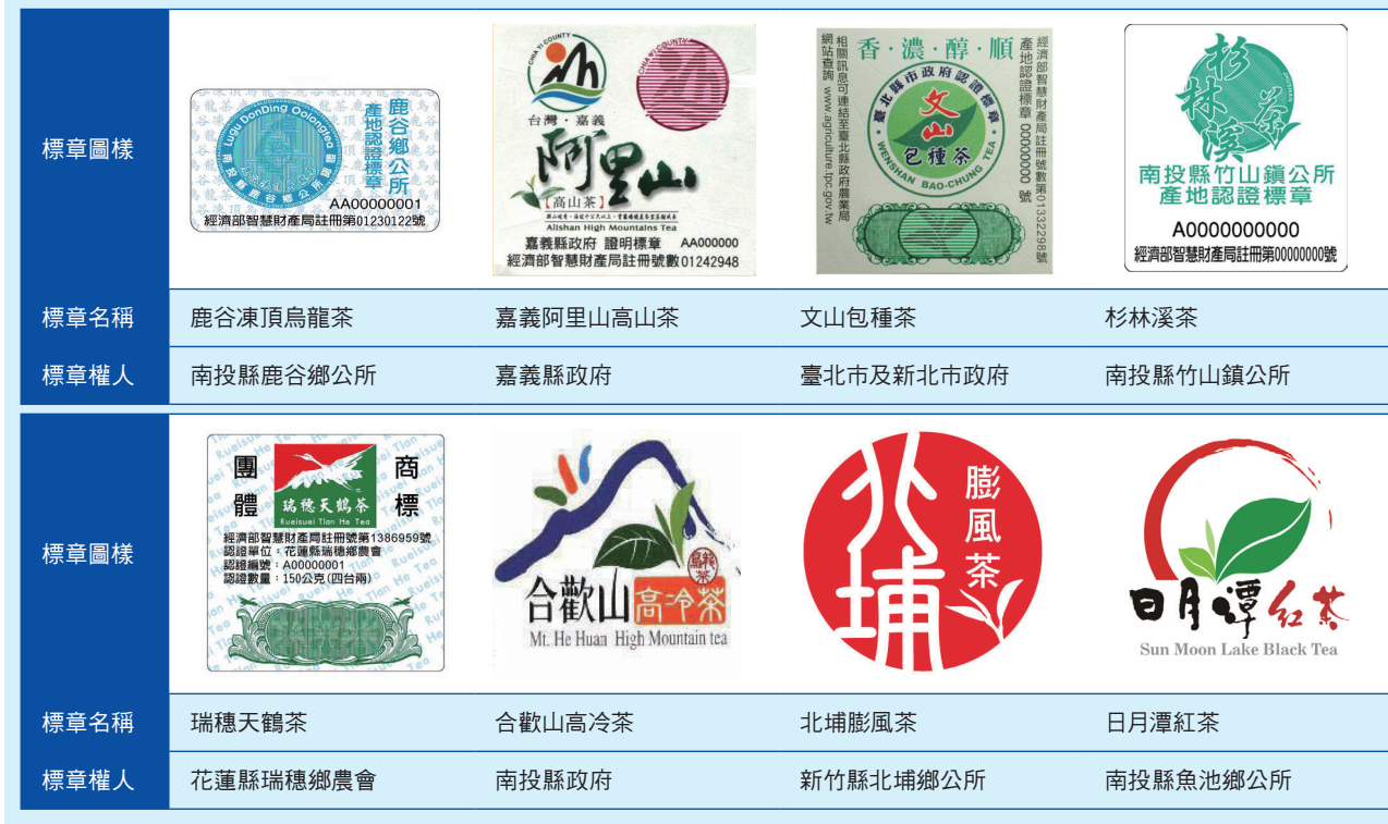
表三 茶葉產地標章圖樣