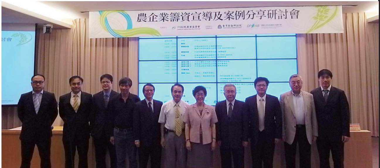
農企業籌資宣導及案例分享研討會與會貴賓合影

產品外，若能取得更充沛的資金，將可投注在專利智財佈局、全球市場開發、國際品牌建立、及國外通路佈建，讓辛苦研發的產品、技術除了能立足臺灣，也能放眼全球。