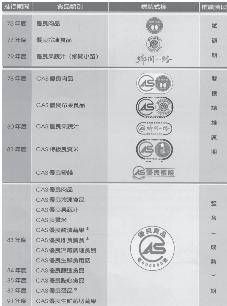
圖三 CAS台灣優良食品證明標章推行之歷程