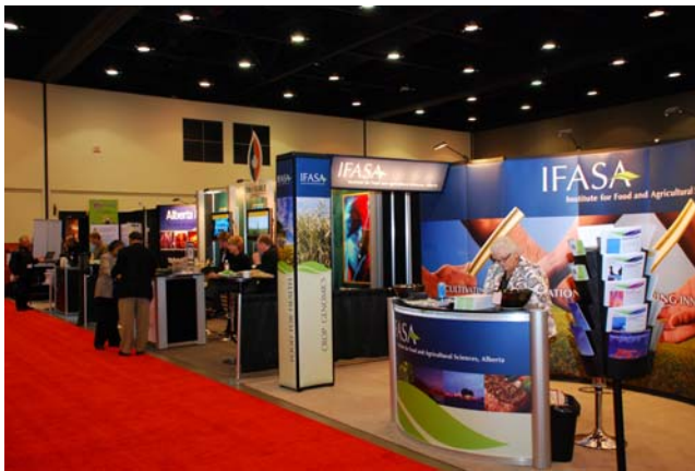
ABIC 2007 廠商展覽會場一隅

為促進產、學、研界的交流，設置 25 個廠商展示攤位及 16 個來自世界各地的傑出農業生技研究成果海報展示。參展單位包括 ABIC 基金會（ABIC Foundation）、Alberta 省農業及食品部（Ministry of Agriculture and Food, Alberta）、Alberta 省農業研究所（Alberta Agricultural Research Institute）、Bio Alberta、加拿大食品檢查署（Canadian Food Inspection Agency）、加拿大小黑麥生物精煉協會（Canadian Triticale Biorefinery Initiative, CTBI）、Genome Alberta、Alberta 食品及農業科學協會（Institute for Food and Agricultural Sciences, Alberta, IFASA）、加拿大 Saskatchewan 省研究委員會（Saskatchewan Research Council）及 Calgary 動物用藥科技大學（University of Calgary Faculty of Veterinary Medicine）等加拿大各界單位；另外，加拿大知名生技公司 SemBioSys Genetics 亦參與其中。