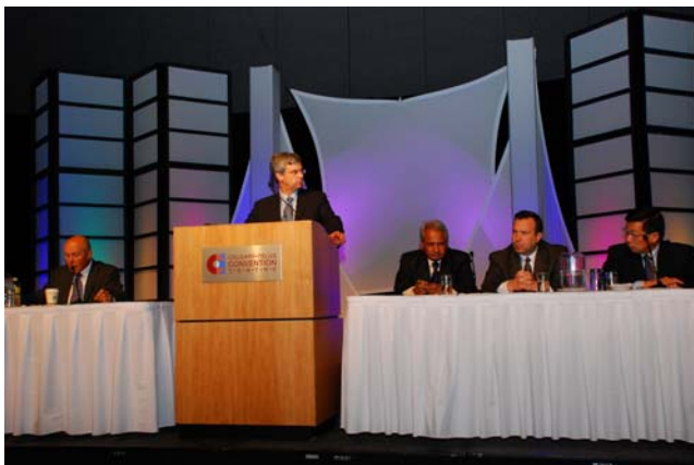
ABIC 2007 國際研討會現場