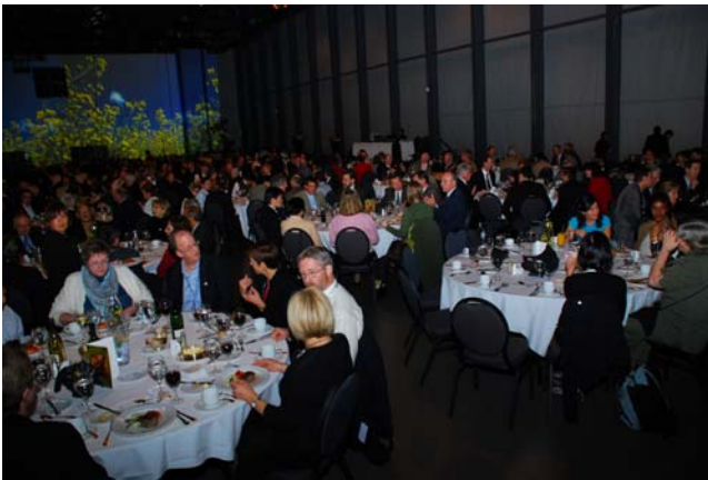
ABIC 大會於最後一晚所安排之晚宴